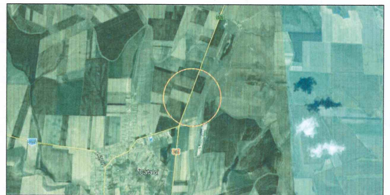
PLAN INCADRARE IN LOCALITATE

ADRESA: STR. PACII, 20 , TELEFON: 0240/511440 int 10 , E-MAIL: cabinet@primaria-tulcea.ro