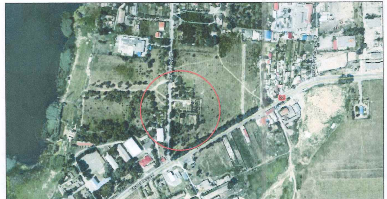
PLAN INCADRARE IN LOCALITATE

ADRESA: STR. PACII, 20 , TELEFON: 02405194140/180 , E-MAIL: cabinetprimar@primaria-tulcea.ro