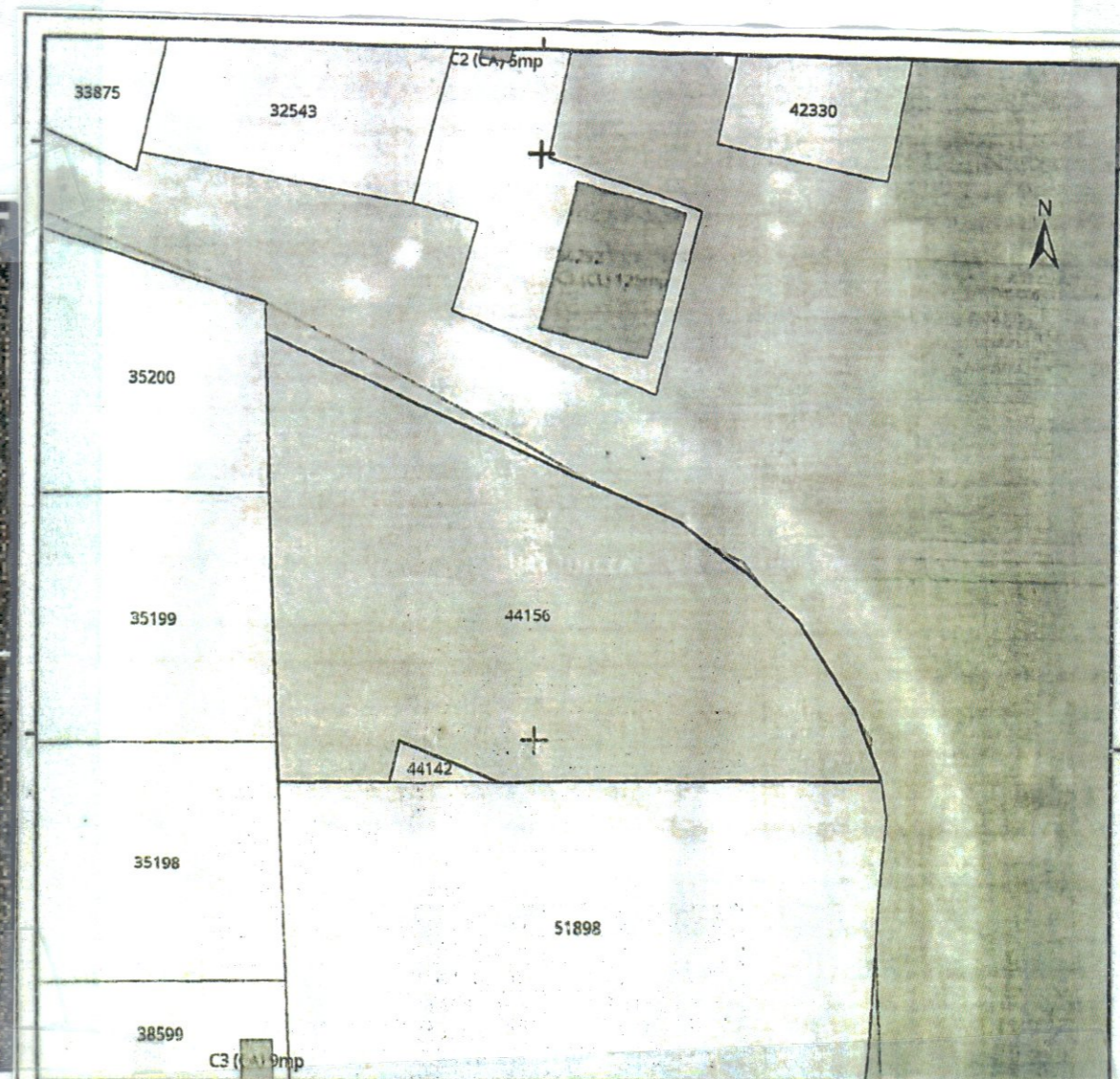
PLAN INCADRARE CADASTRALA