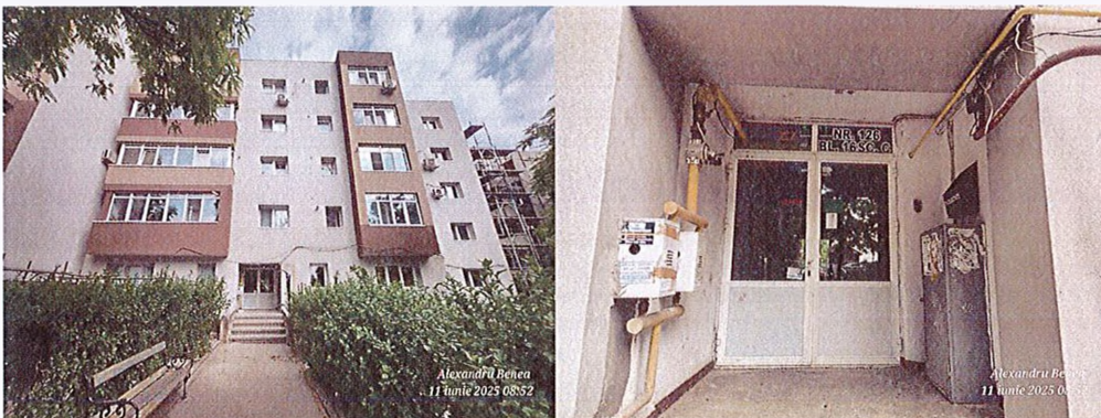
DETALII BLOC SUBIECT SI ACCES SCARA BLOC