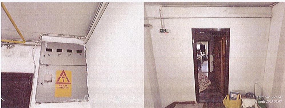
DETALII CONTOR ENERGIE ELECTRICA SI USA ACCES APARTAMENT