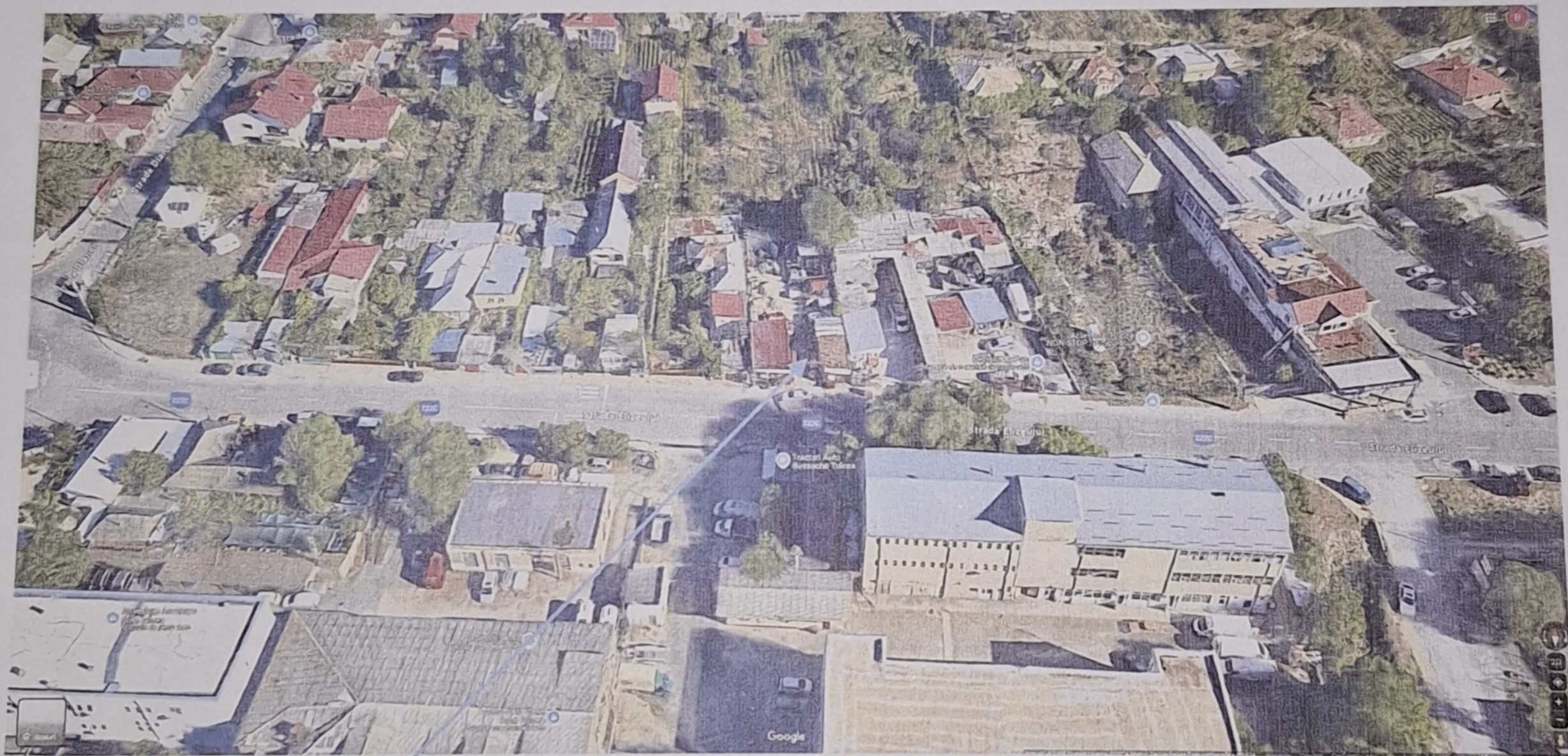
Detalii localizare proprietatea subiect