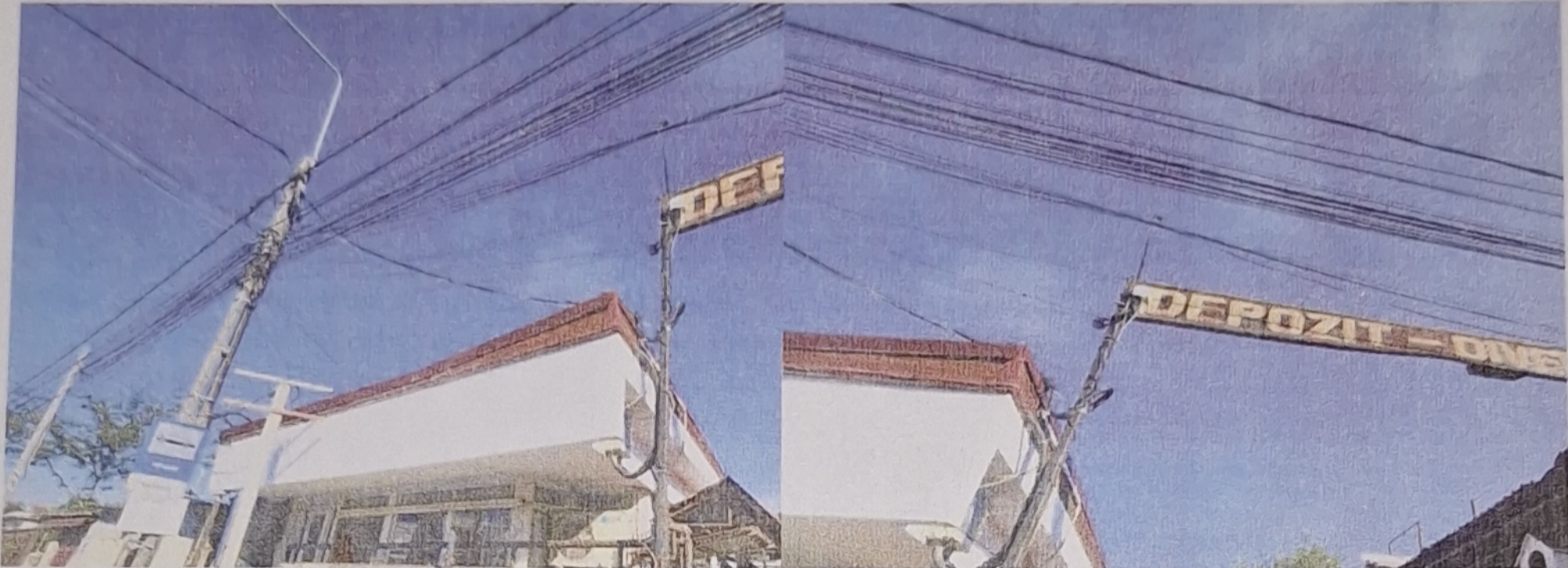
DETALII ACCES PROPRIETATE