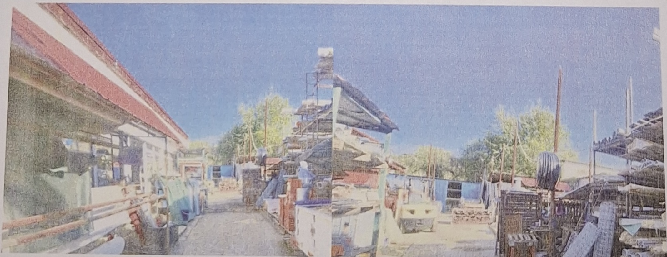
DETALII TEREN SUBIECT