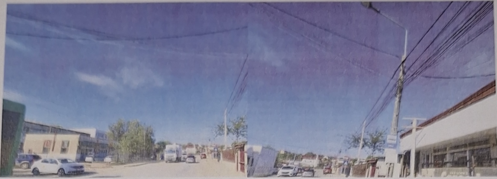
DETALII STR. ELIZEULUI